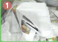
リサイクル可能な紙類