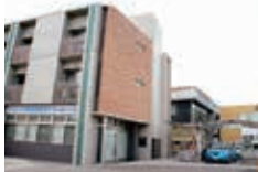
株式会社キャビック 本社・外観

「移動」「介護」「環境」の3つのキーワードに、移動と介護を一体化したサービスの提供、また地球環境のことも考えられた車両手配を行われています。当初はタクシー事業から始められ、昭和52年に京都府下で初めてリフト付き福祉タクシーを導入、そこから福祉事業に参入されました。平成12年には、2級ホームヘルパー養成教室「すいとハンズ」を立上げ、訪問介護事業の指定を受けて、府下で初めて「介護タクシー」のサービスを開始されたそうです。