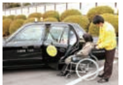
介護と移動が一体となった「ケアケアタクシー」。新しい概念のタクシーサービスです。買物、通院、食事等の移動や在宅での介護までお任せ!

それ以降、介護事業として夜間対応型訪問介護事業、グループホームや通所介護事業を開始。現在では京都市と向日市の3か所でグループホームや併設した小規模多機能型居宅介護事業など地域密着型介