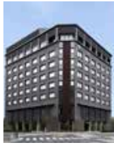
ハトヤ瑞鳳閣 外観

今回は、「株式会社ハトヤ瑞鳳閣」さんです。昭和25年「ホテルはとや」さんとして創業されました。その後、何度かのリニューアルを経て、2014年5月に京都駅前初、自家源泉の湯を備えた“和”のホテル「京湯元ハトヤ瑞鳳閣」としてグランドオープンされました。京都駅前にあることによる利便性や地下910mからくみ上げる自家源泉の半露天風呂を特徴とされ、創業時からの旅館らしい和のしつらえや、おもてなしの心を大切にされており、なんと3年連続でミシュランガイドに登場し、京都を代表するホテルとなっています。ホテル内は和テイスト中心の内装で清潔感があり、半露天風呂からは京都市内を見渡すことができ、京都駅前にこんな癒される空間があったことに驚きました。