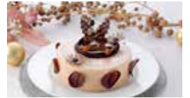
ノエルドール 4,860円(税込)

第4のチョコレートと言われるゴールドチョコレートを使用。中にしのぼせた、自家製のオレンジコンフィと香り高いヘーゼルナッツプランドー、厳選された素材の組み合わせが織りなす新しい味のチョコレートケーキをご堪能ください。