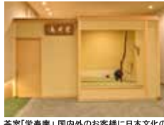
茶室「茶寿庵」国内外のお客様に日本文化の体験施設として貸し出しもされています。

〒600-8234 京都市下京区西洞院通塩小路下 南不動堂町802番地 FAX 075-343-3193 URL http://www.kyoto-hatoya.jp/