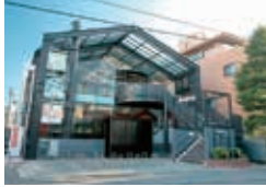
スポーツクラブヘミング 出町・外観

平成14年に設立。自宅をファーストブレイス、会社や学校をセカンドブレイス、そして自分らしくゆっくり過ごせる「第三の快適空間」をサードブレイスと位置づけ、地域の皆様に、その「サードブレイスを提供する」をビジョンに掲げ、総合フィットネスクラブ「ヘミング」をスタートされました。現在、総合フィットネスクラブ・キッズスクール「ヘミング」、タニタプロデュースの女性専用フィットネス「フィッツミー」、障がい児通所支援事業・放課後等デイサービス「ジュニアスペース・らいぶ」の事業展開をされています。