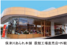
保津川あられ本舗 蔵館工場直売店・外観

“あられ”に使用されている“もち米”は、佐賀県産ヒヨク餅米、地元丹波産新羽二重糯米を主に国内産もち米を100%使用し、“塩”には伊豆大島産の海水塩を中心に旨みのあるものを、“豆”には大粒で柔らかい地元丹波産の黒豆と甘みのある「おおつる大豆」を使用するなど素材のこだわりには余念がありません。製法についても、食べた時に口に広がる米の香りを最も大切に「丸つぶ蒸し」という