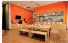
蔵館工場直売店 店内の憩いの場