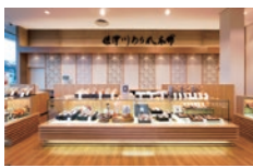
保津川あられ本舗 蔵館工場直売店・店内

製法で、米粒そのままを蒸し上げる昔ながらの製法を採用されており、米の香り、甘みをそのままあられに生かし、ひとつひとつの工程に職人の心と技を込めながら10日ほどかけて