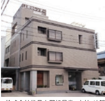
株式会社伏見上野旭昇堂 本社・外観

第112回は「株式会社伏見上野旭昇堂」さんです。「株式会社伏見上野旭昇堂」さんは、1905年滋賀県土山町（現：甲賀市土山）にてうちわの製造から始まり、日露戦争勝利の記念として「日の昇る会社」「旭昇堂」と命名されました。後に京都市伏見区にて「上野旭昇堂伏見店」の名称にて不織布カレンダーの製造を開始、会社名は現在の（株）伏見上野旭昇堂となりました。