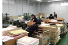
京都工場 カレンダーの製作現場

伝統の「うちわ」、「扇子」の製造販売も大切に考えておられ、竹の材料で安定して生産できるよう工場を海外へ進出させるなど努力をされてきたそうです。