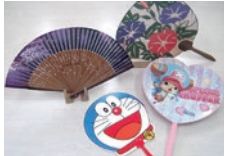
オリジナルの「うちわ」、「扇子」

現在は、夏には「うちわ」、「扇子」。冬には「カレンダー」を中心に製造販売を行われています。時代の流れの中で、電化製品が発達し「うちわ」、「扇子」が生活必需品ではなくなりつつありましたが、子供たちに人気の漫画などのキャラクターとコラボした商品や、時代の先端素材である不織布を使用したカレンダー等、市場に必要とされているものを産みだし製造販売されてきました。また、新しいものだけでなく