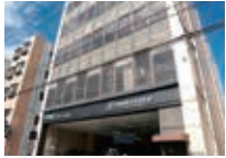
株式会社 岩井商会・外観

第129回は、自社製車両・部品の製作、日本国外の車両・部品の輸入をされている「株式会社岩井商会」さんです。京都で自転車の直営販売店「イワイサイクル」の運営もされています。