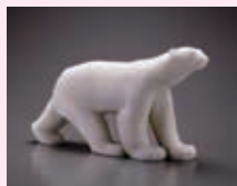
フランソワ・ポンポン(シロクマ) 1923-1933年 群馬県立館林美術館蔵

2021年夏、日本初となるフランスの彫刻家フランソワ・ポンポン(François Pompon, 1855-1933)の回顧展を開催いたします。ポンポンが彫刻家を志した初期の作品から、動物彫刻家となって名作『シロクマ』(1923-1933年)を生み出し名声を確立するまでの作品によって、彼の生涯と作品の魅力に迫ります。