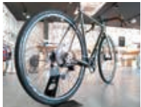
ハンドメイドバイク

㈱岩井商会さんには、自社ブランドganwell(ガンウェル)があり様々な製品の企画をされています。また昭和40年頃に京都市南区に開設したスポーツ車専門店に併設する形で、昭和51年頃にオーダーフレーム工場を開設。その後、プロ競輪用の厳しい基準をクリアした工場だけが認定