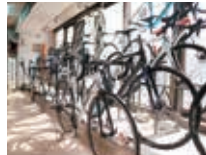
イワイサイクル 2F 店内の様子

卸売業では、デパート向けに開始後、量販店にも販売をされたことで急成長されました。その後、大手メーカーのOEM販売や海外の自転車の輸入などさまざまなことに取り組み、現在は大手家電量販店との取引を主に行われています。支持される理由として、豊富な在庫と、その在庫管理をPOSで一括管理されていることにより、リアルタイムで在庫の状況を見ることが出来る為、お店やお客様にとって大変便利なシステムを構築されています。