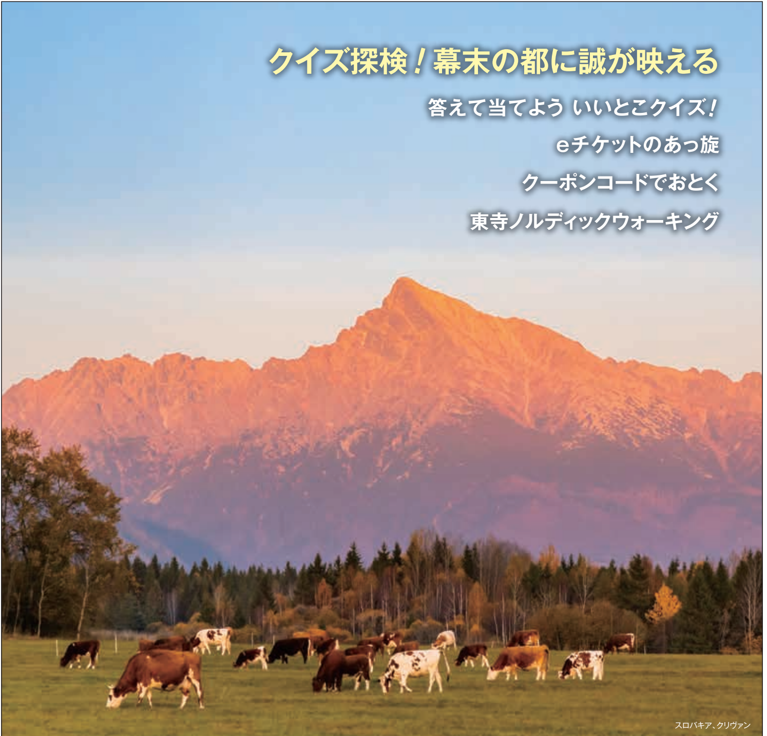
スロバキア、クリヴァン