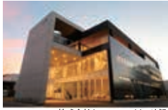
株式会社クロスエフェクト 外観

第133回は、プロダクトの創出や医療分野において、デザイン・設計から開発試作品製作、小ロット生産まで一貫して対応されている「株式会社クロスエフェクト」さんです。