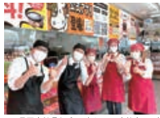
長岡店社員とパートさん。いつも仲良くしています。

京都市右京区太秦森ヶ町30-5 URL: http://www.yamamuraya.com/