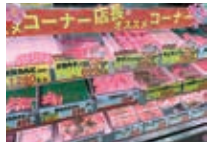
やまむらや 店内 商品陳列棚

が、社内環境を優先され現在は理想の形になってきたということです。実際に訪問した店舗や事務所の中は整理整頓が行き届いており、社員のことから配布中のチラシに至るまで一目でわかるように整えられていました。iPadを使ってどの社員でも社内の経営状態がわかるように見える化もされています。