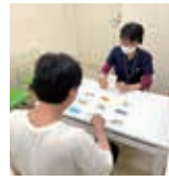
失語症訓練の様子

障害に対して、相談、評価、助言、訓練を行います。このような施設は珍しく、更に乳幼児から高齢者の方まで年齢を問わず受診が可能。診察室には絵本などがあり小さなお子さんでも楽しみながら受診できるような工夫をされています。