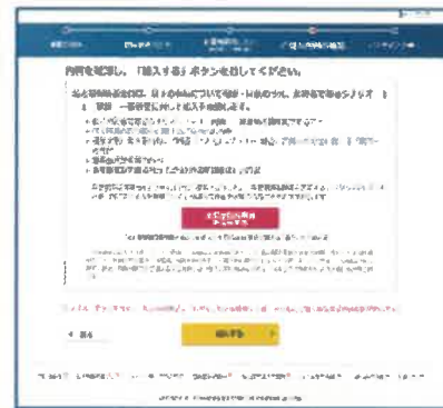
ご加入内容確認画面