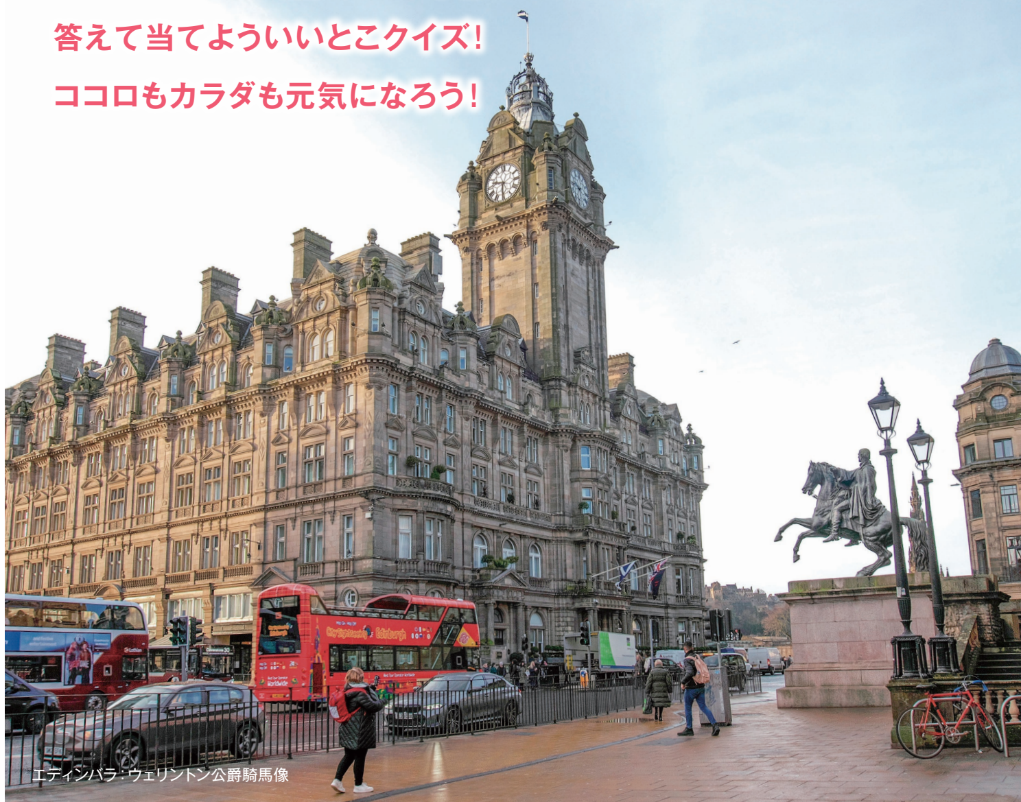
エディンバラ:ウェリントン公爵騎馬像